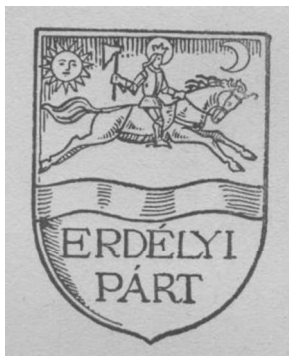
3. ábra: Az Erdélyi Párt jelvényének késői változata 1943-ból Figure 3.: The late version of the Transylvanian Party insignia from 1943